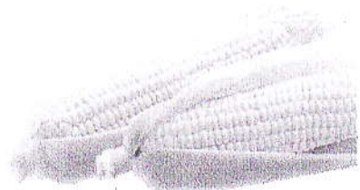
トウモロコシのタネ