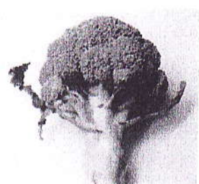
ブロッコリーのタネ