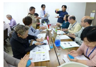
もの作り<スライム>