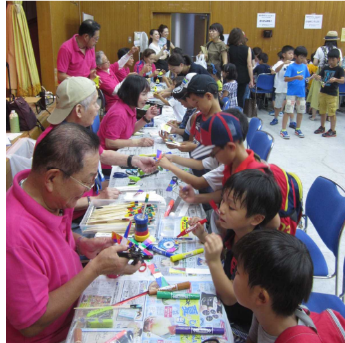
<もの作り>は楽しさ作り！

コメントは新しいものから表示されます。 コメント本文中とURL欄にURLを記入すると、自動的にリンクされます。