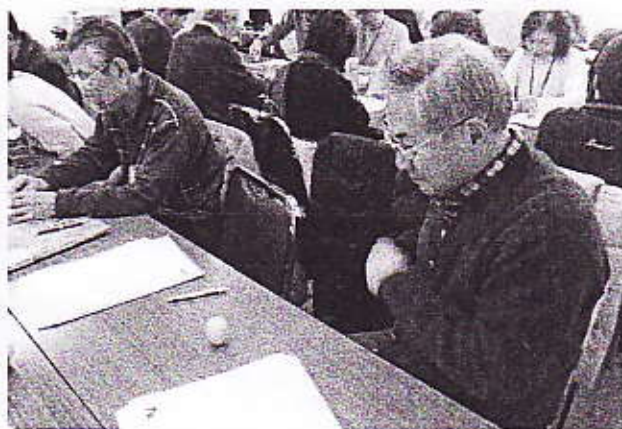
みんなでワイワイやるから面白い！かも？ なんと12名の人が卵立てに成功！ビックリ！