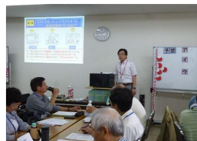
(9/29)電子レンジで遊ぼう