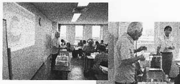
(9/10)おもりのはたらき

子どもたちが、自由に作成できる、しくみが出来上がっていますので 今後の地元活動のために、ぜひ、参考にしてください。